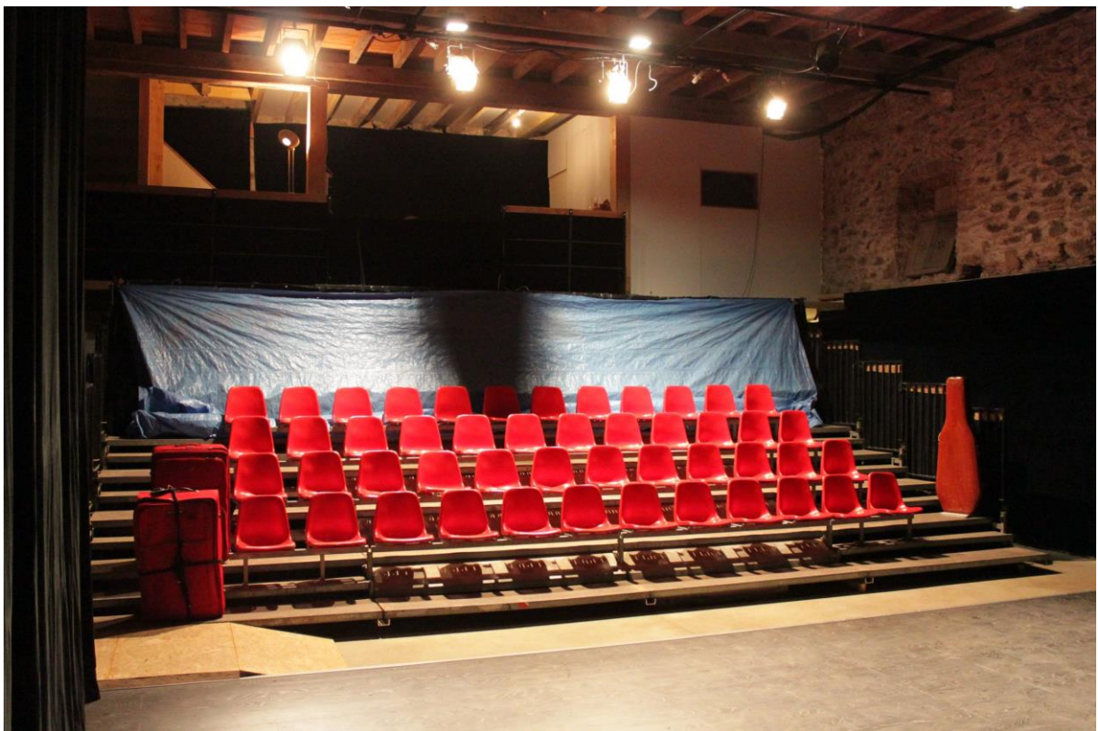
Vue gradin et régie sur mezzanine