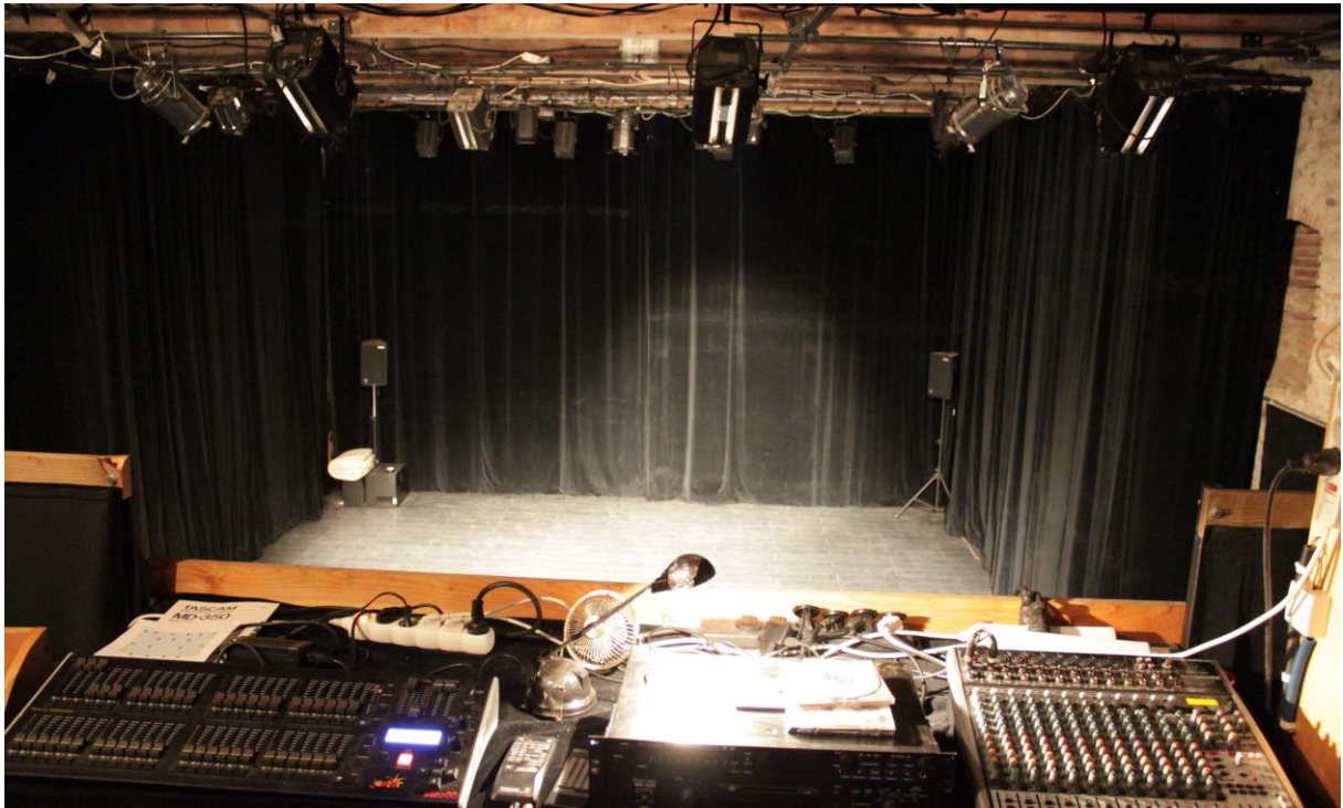
Vue plateau depuis la régie